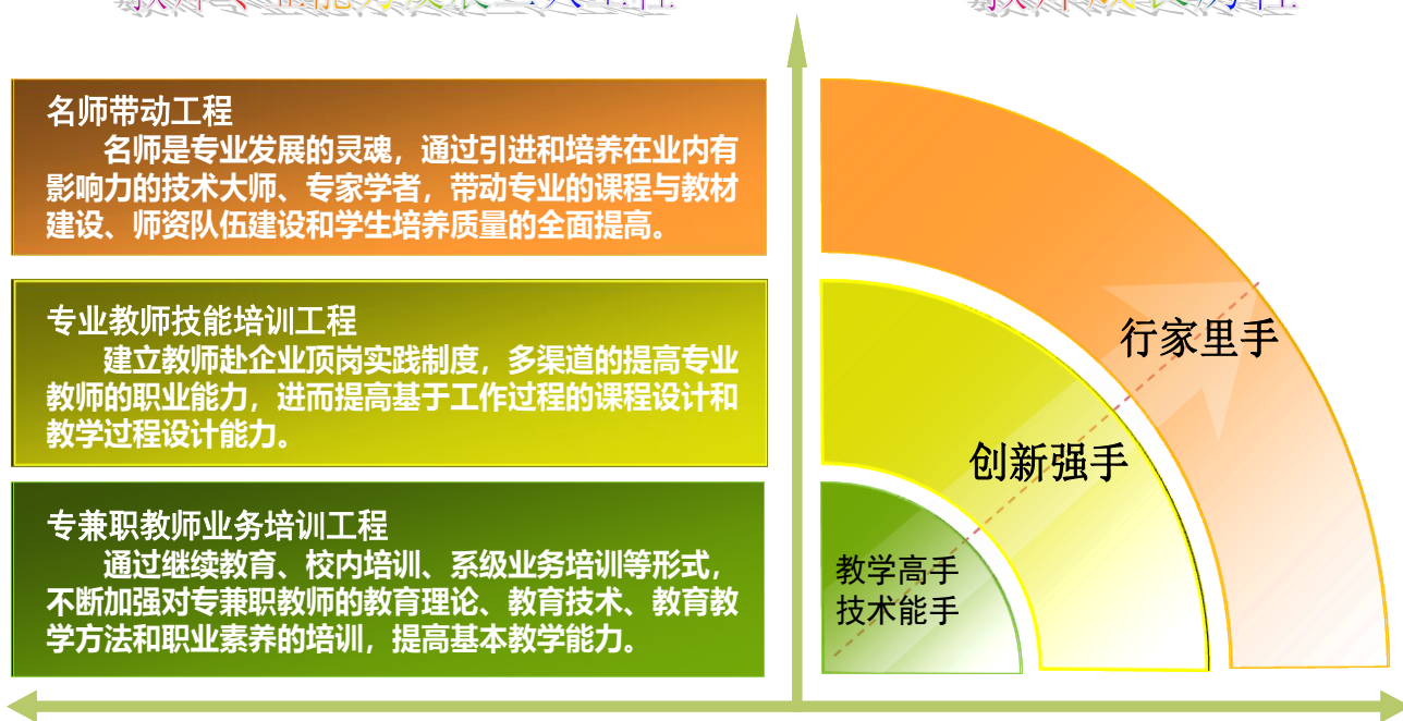
图1 食品专业群“双师”结构教学团队建设途径