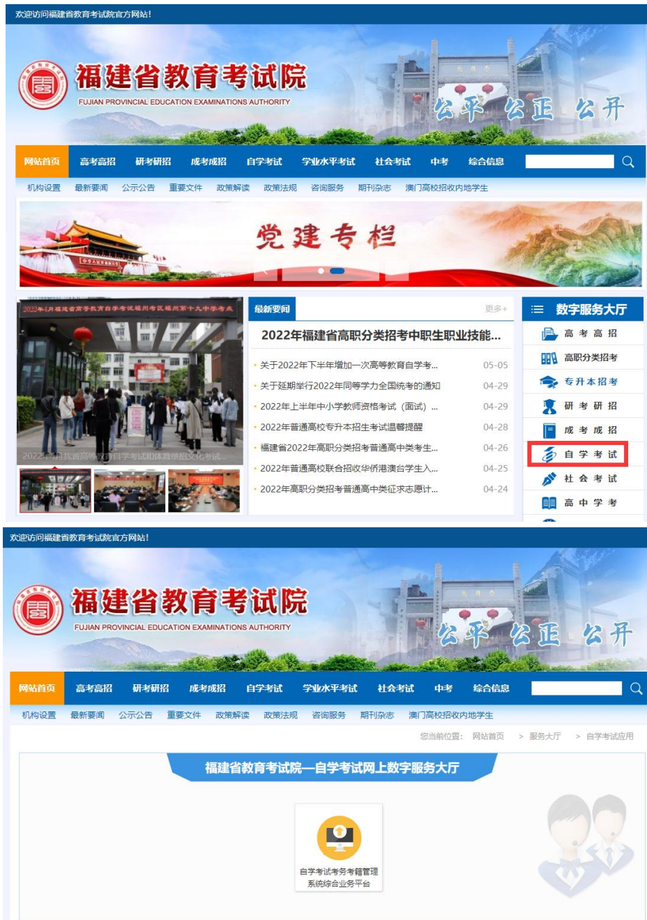
图 1.1 登陆福建省教育考试院 www.eeafj.cn ，点击“自学考试”图标进入“福建省高等教育自学考试考务考籍管理系统”。

登陆“福建省教育考试院 www.eeafj.cn ”——数字服务大厅，选择“自学考试”进入数字服务大厅，点击进入“福建省高等教育自学考试考务考籍管理系统”。