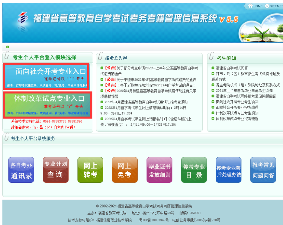
图 1.2 考生根据自己准考证第一位选择入口，输入证件号、密码进入“考生个人管理平台”