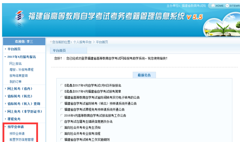
图 2.1.1 选择“预毕业申请”模块进入办理。

注：根据福建省教育考试院关于“高等教育自学考试毕业审核工作的通知”要求，对福建省自学考试毕业审核预申请步骤及确认方式进行调整，考生本人根据系统要求申请提交预毕业专业信息及上传本人近期三个月内白底彩色证件照，并在预申请规定时间内将确认后的相关材料拍照上传系统平台并确认提交预申请，完成毕业申请步骤。