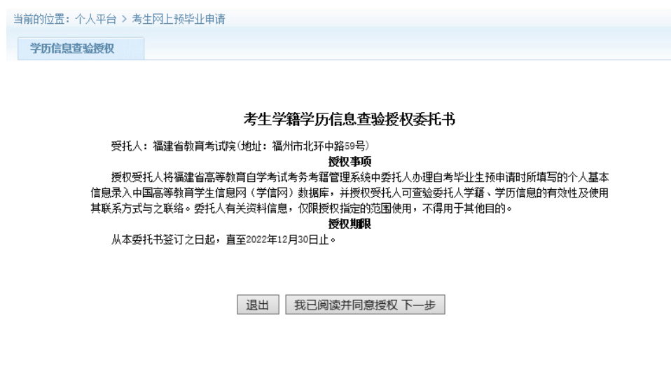
图 2.1.3 阅读预毕业申请须知及考生学籍学历信息查验授权委托书，点击进入下一步