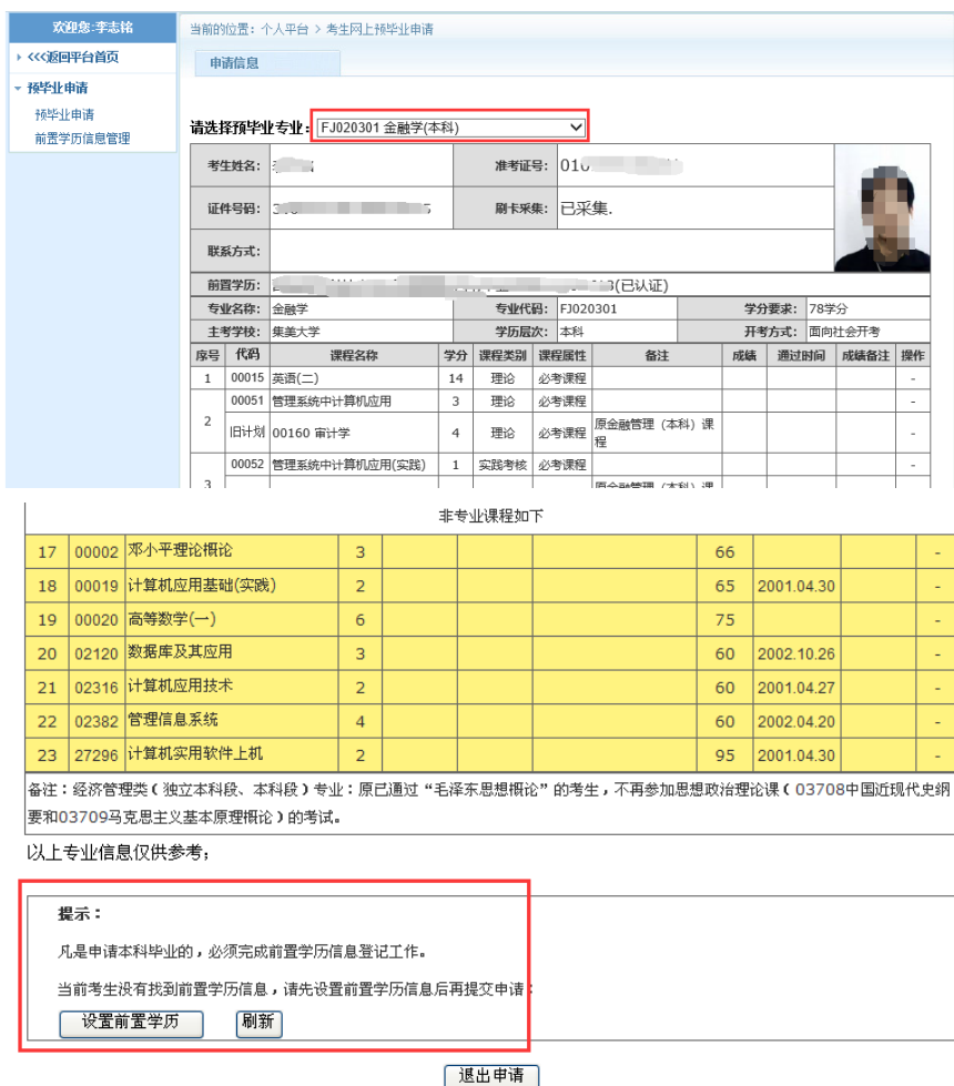
图 2.1.4 预毕业专业选择及设置前置学历认证