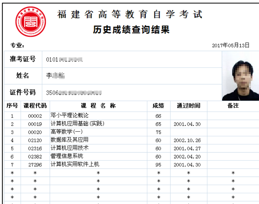
图 2.1.4 核对通过课程