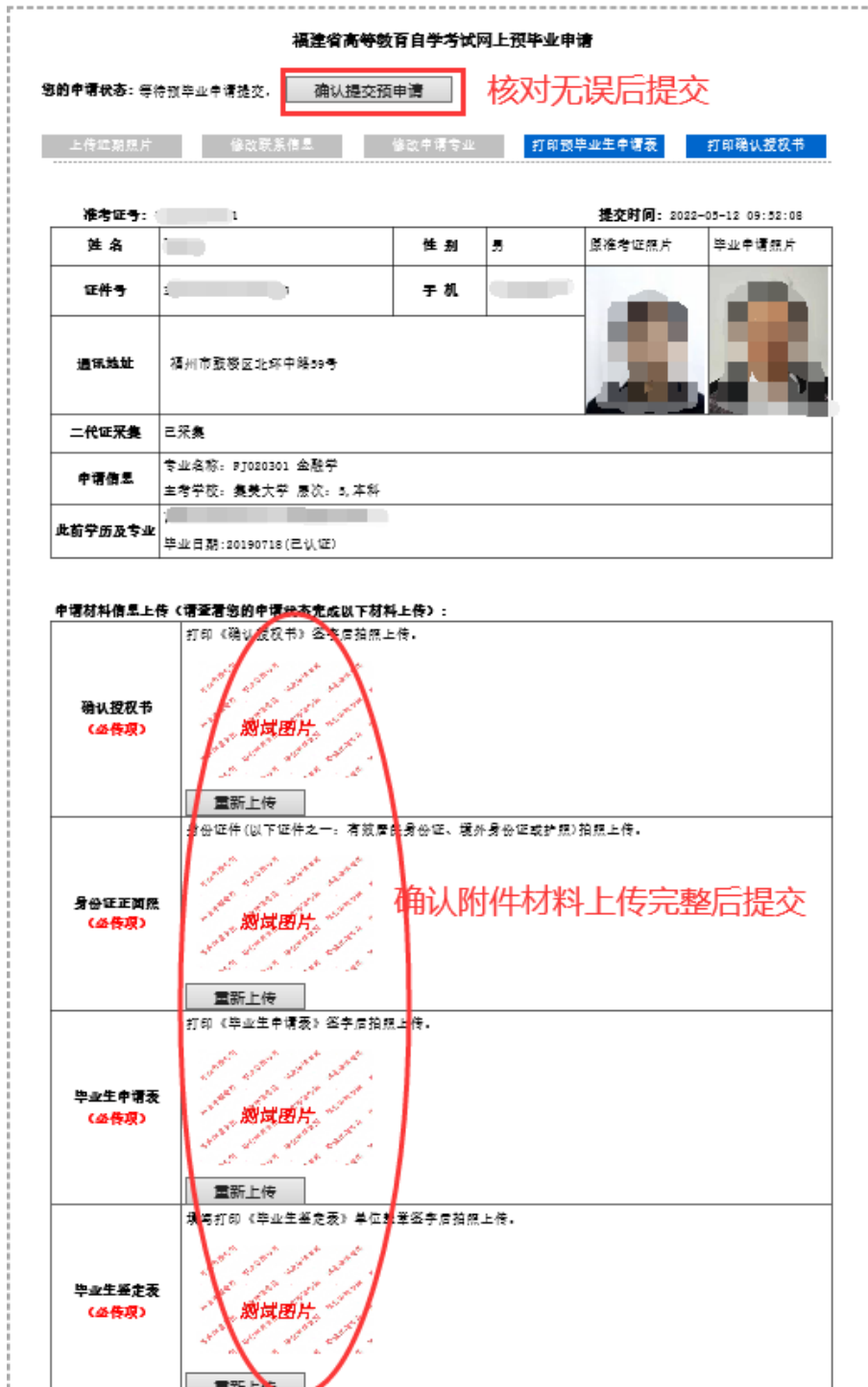
图 2.1.10 上传所有材料后, 点击确认提交预毕业申请完成申请步骤, 等待所属教育招生考试机构(主考学校)审核。